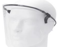
リケガード (SIAA認証 抗菌・抗ウイルス加工)